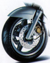
Sensationell: Integrales Bremssystem mit 2 Scheibenbremsen vorne.