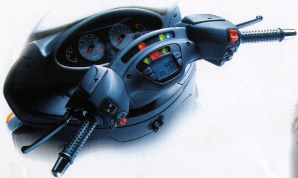
Analog-digitale Instrumente mit Bordcomputer, einschließlich Glatteis-Warnhinweis.

X9 ist anders. X9 ist etwas Besonderes! Allein das Design - Edel, agil und aerodynamisch. Die Linienführung ist das Resultat von aufwendigen Designstudien mit modernsten Simulationssystemen und wurde im Windkanal optimiert. Formvollendet - Der optische Gesamteindruck von X9 setzt neue Maßstäbe!